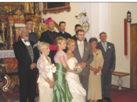
Skupna fotografija v cerkvi