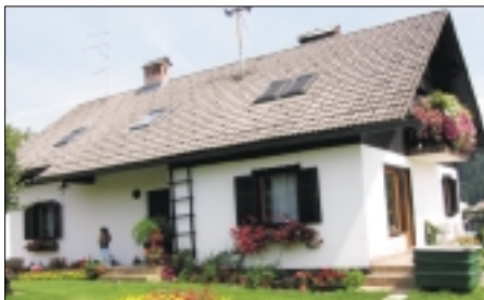
hiše: 3. mesto: Pavla in Viktor Srša Rafolče 5, 1225 Lukovica