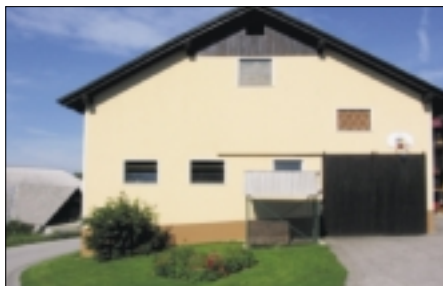
kmetije: 1. mesto: Vika in Leopold Dežman Gabrje 2, 1223 Blagovica