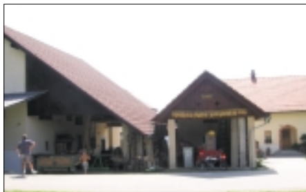
kmetije: 2. mesto: Jelka in Alojz Drčar Gradišče 24, 1225 Lukovica