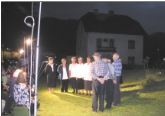
Ljudski pevci iz Krašnje

Tudi letošnje leto je občinski praznik zaznamovala pomembna obletnica, saj se v letošnjem letu izteka deseto leto samostojne občine Lukovica. Kot vsako leto je tudi letošnji praznik zaznamovalo kar nekaj prireditev, ki so se zgostile ravno v dneh okoli praznika.