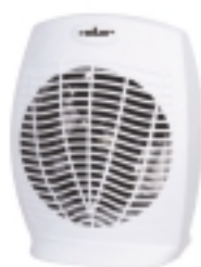
Kaforifer HL 710