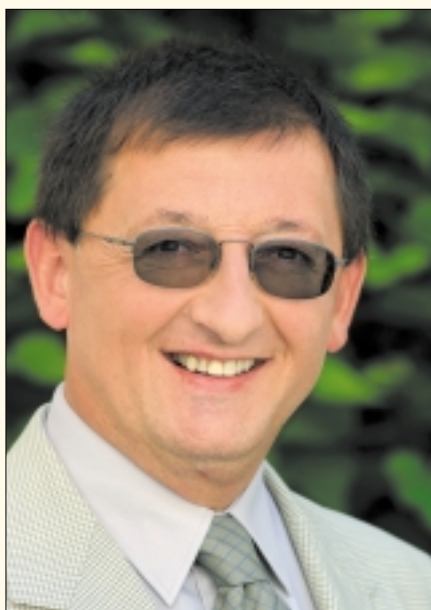
Spoštovani občani občine Lukovica!

Za nami je nič kaj poletno poletje. V Državni zbor se je ponovno vrnil običajni vrvež, značilen za običajne delovne dni. V času, ko pišem utrinke iz poslanskih klopi, se pripravljamo na za nekatere težko pričakovani referendum o RTV Slovenija. Z leve in desne nas bombardirajo o morebitnih posledicah tega referenduma. Prepričujejo nas, kako je bilo včasih lepo. Prepričujejo nas o tem, da je nekaj povsem normalnega, da je bivši predsednik ZLSD (bivših komunistov) mag. Janez Kocjančič predsednik sveta RTV Slovenija. Mediji nas obveščajo o tem, da se prvaka stranke LDS mag. Rop in SD (bivša ZLSD) Pahor prepirata, čigava je sedanja RTV Slovenija. Poleg tega pa tisti, ki zagovarjajo sedanjo ureditev na RTV Slovenija, vse prevečkrat pozabijo, da je sedanji zakon o RTV Slovenija ustavno sodišče razglasilo za neustavnega. Posledice izvajanja tega zakona so vidne tudi v veliki finančni izgubi avnega zavoda RTV Slovenija in navsezadnje v kvaliteti samega programa RTV Slovenija, kar pa občutimo vsi gledalci in poslušalci tega javnega medija.