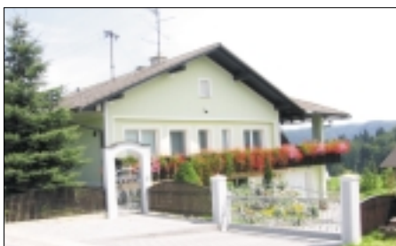
hiše: 5. mesto: Angelca in Marjan Vesel Gradišče 3, 1225 Lukovica