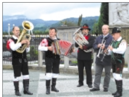
Živabno dogajanje po cerkveni poroki

Županu in njegovi ženi želimo veliko veselja in lepih trenutkov na njuni skupni življenjski poti!