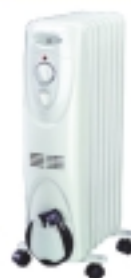
Oljni radiator Heller 1507