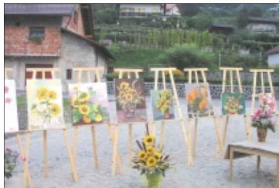
Razstava Ex Tempora