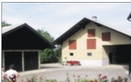
kmetije: 4. mesto: Emilija in Avgustin Burja Kranje Brdo 15, 1225 Lukovica