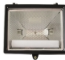
Halogen reflektor 150 W