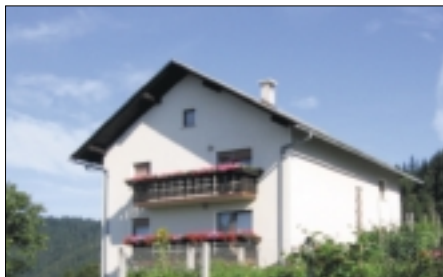
kmetije: 3. mesto: Marija in Marko Kavčič Gabrje 4, 1223 Blagovica