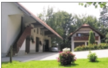
kmetije: 5. mesto: Milka in Stane Homar Dupeljne 1, 1225 Lukovica