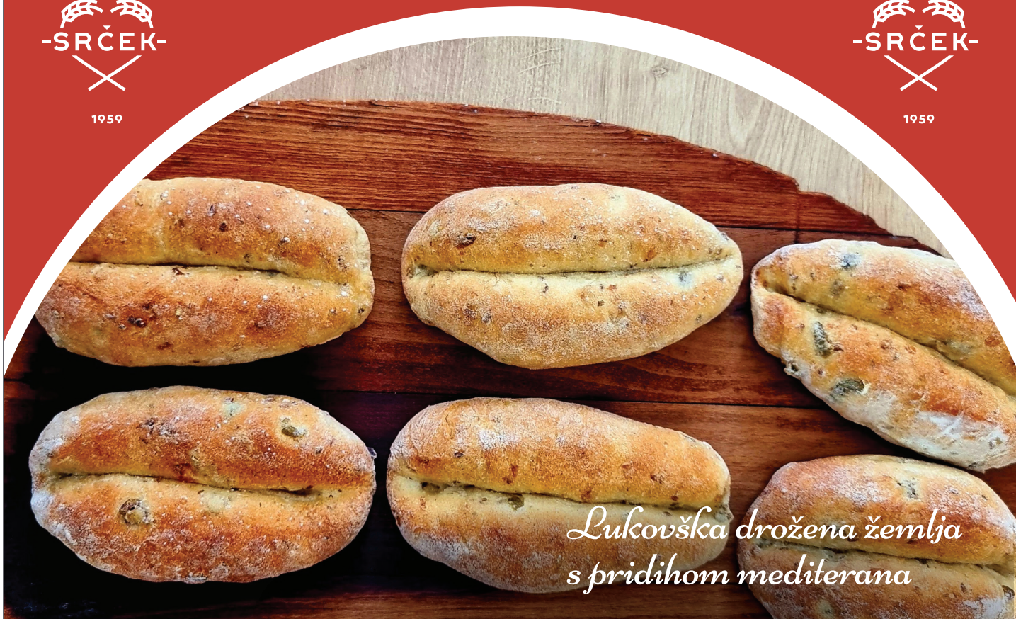
Lukovška drožena žemlja s pridihom mediterana