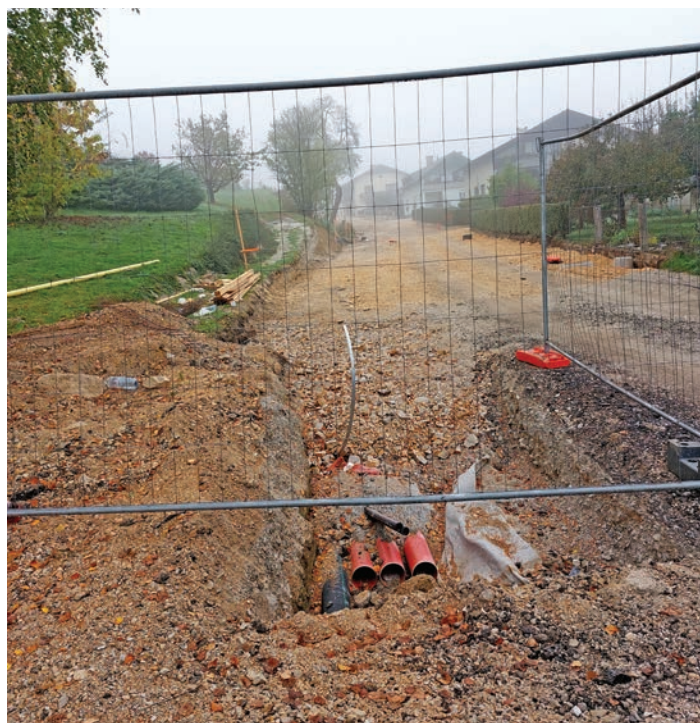
Rekonstrukcija lokalne ceste v naselju Rafole.