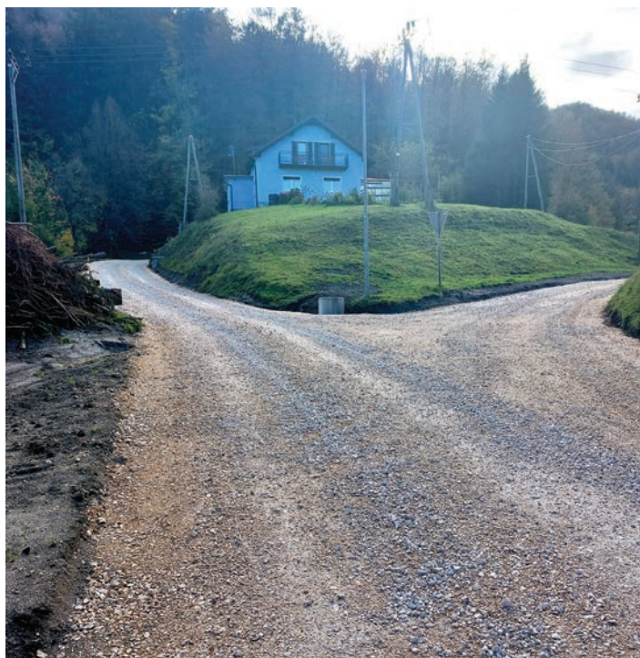
Rekonstrukcija najbolj poškodovanega odseka ceste v naselju Zavrh pri Trojanah.