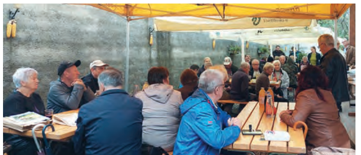
Za mizo na Blatni Brezovici.