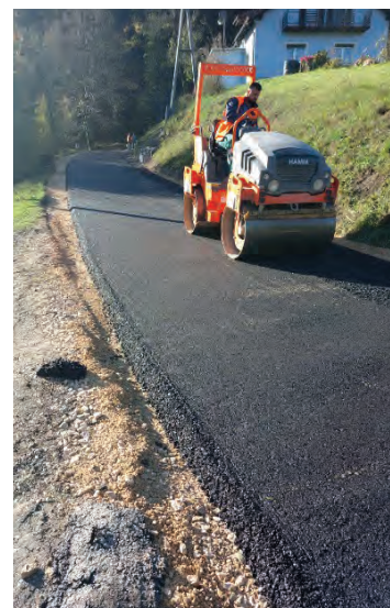
Asfaltiranje ceste proti naselju Zavrh pri Trojanah.