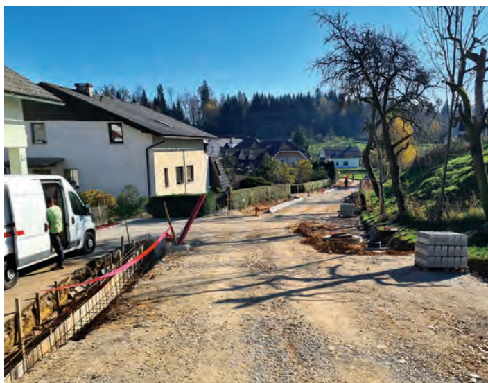
Pogleda na gradbišče ceste v Rafolčah.