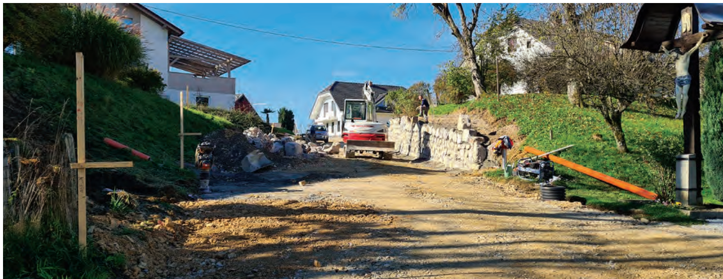
Pogleda na gradbišče ceste v Rafolčah.

Zaključena je rekonstrukcija najbolj poškodovanega odseka ceste v naselju Zavrh pri Trojanah. Pri rekonstrukciji lokalne ceste skozi naselje Rafolče potekajo dela skladno s planom. Izvedeni sta kabelski kanalizaciji za javno razsvetljavo in dela na elektro omrežju za potrebe gradnje nove transformatorske postaje. Zamenjan je spodnji ustroj v območju ceste in pločnika, zgrajena meteorna kanalizacija. Trenutno se izvajata dve oporni konstrukciji za zavarovanje ceste in sosednjih zemljišč pred erozijo ter polaganje ločilnih robnikov med voziščem in pločnikom.