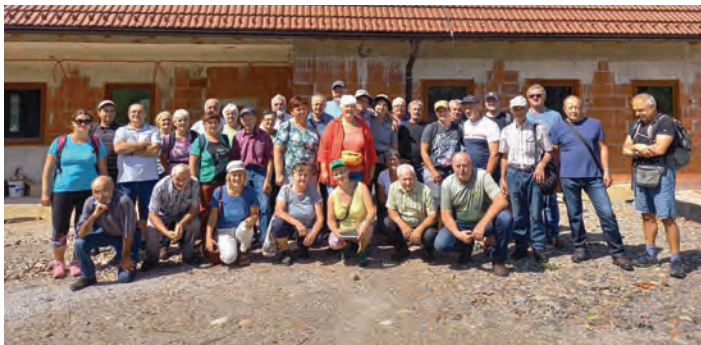
Skupni objekt, ki bo kmalu služil svojemu namenu: izobraževanju, srečevanju, delavnicam, gostinstvu in turizmu.