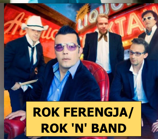
ROK FERENGJA/ ROK 'N' BAND