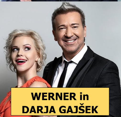
WERNER in DARJA GAJŠEK