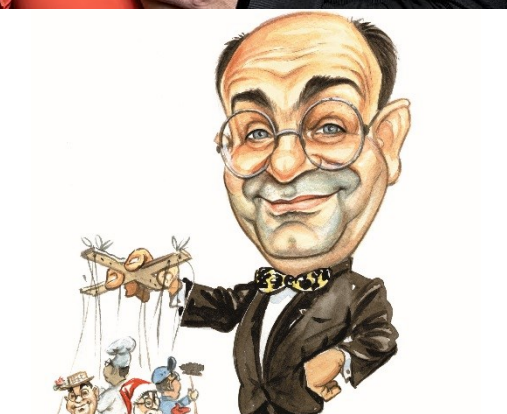
GLUMAČ KONRAD PIŽORN –KONDI