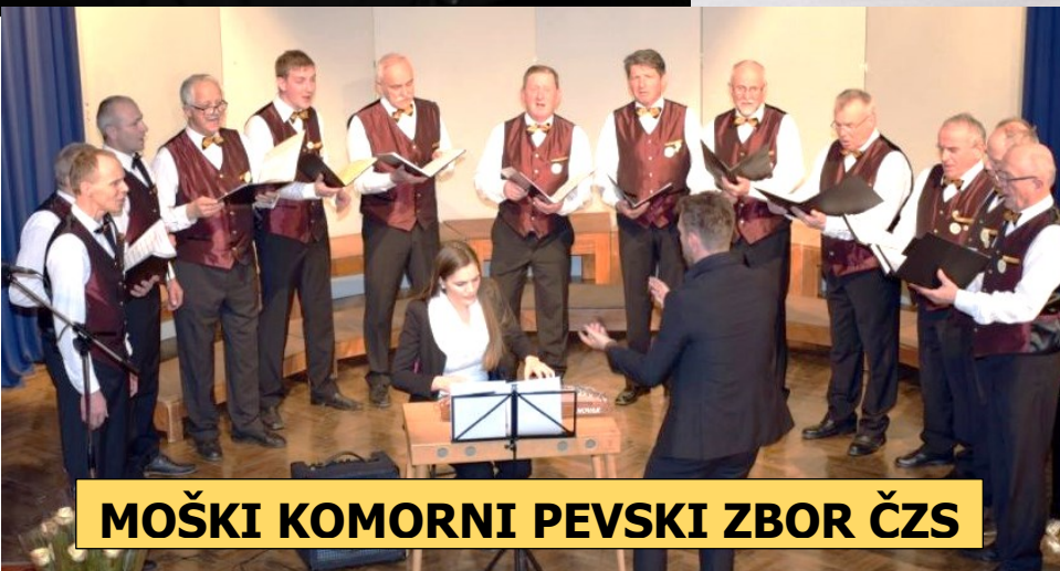
MOŠKI KOMORNI PEVSKI ZBOR ČZS